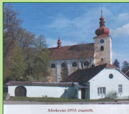
Morkovice 2010. muzeum.