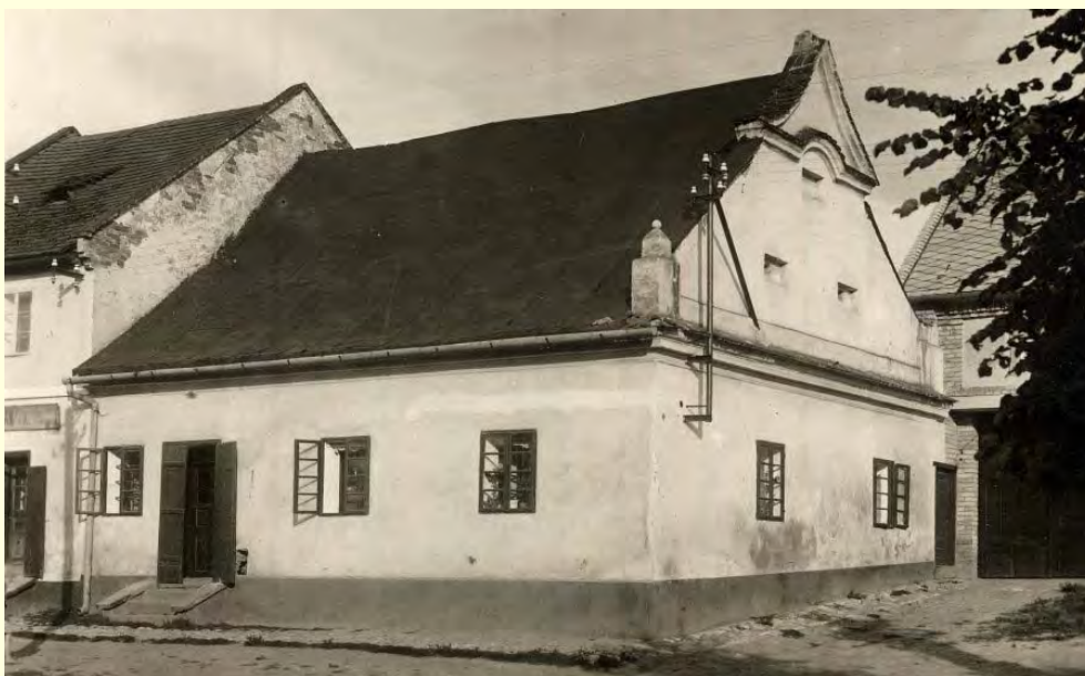
dům na náměstí vedle Fortny (č.p. 212) zvaný "Rybárna" před zbořením v srpnu 1928