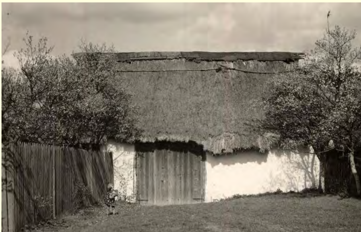
stodola s doškovou střechou, která patřila k domu v ul. Krátká č.p. 67