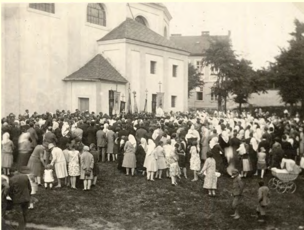
svěcení zvonu Maria