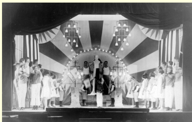
úprava scény v Sokolovně