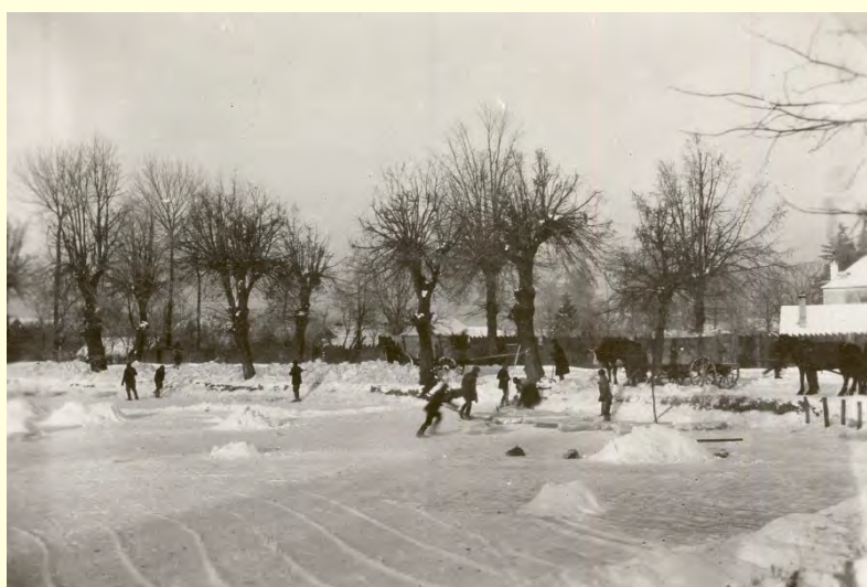
„Ledování“ na Ovčáčku, Vánoce 1928