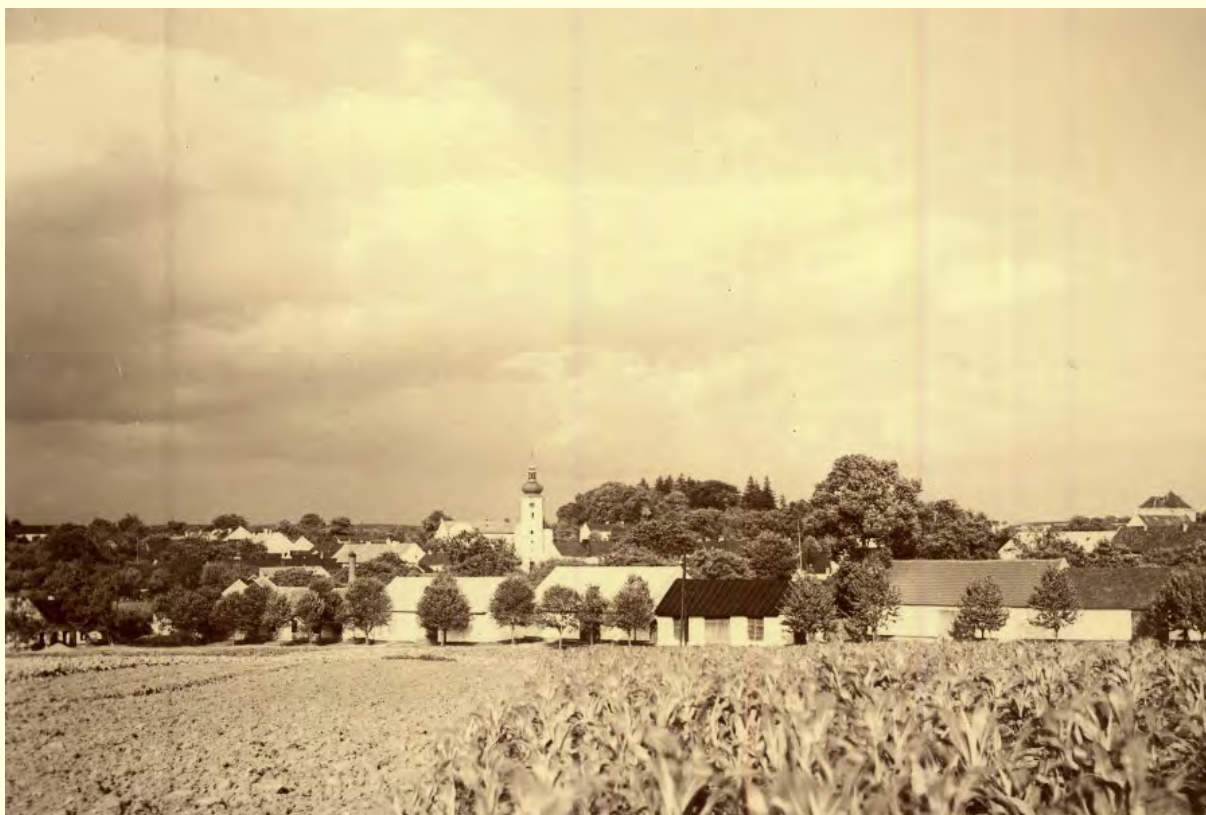
pohled z prasklické cesty 23.8.1928

Státní pozemkový úřad přidělil zmlou pod rybníkem obci. Obec prohlásila, že přijme zmlou a břeh, který drží rybník, jen tehdy, bude-li jí přidělen i rybník. Pozemkový úřad však o rybníku již rozhodovati nemohl, protože parcelace velkostatku byla ukončena.