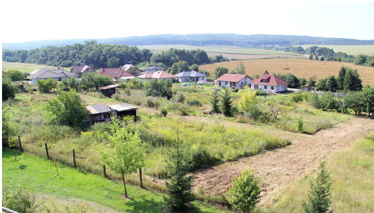
končící zahrádkářská kolonie na ul. Jabloňová, vysečené pásy ukazují místa, kudy povedou inženýrské sítě pro budoucí bytovou výstavbu