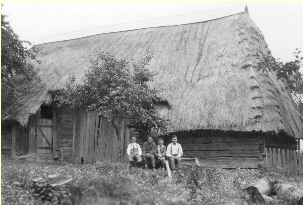
Stodola k č.p. 14, postavená roku 1796, majitel František Burša

Na témže místě hospodaří přes 150 r. rody Malý č. 45, Pěňčík č. 35, Krejčí čís. 46 a 2, Tesař čís. 7.