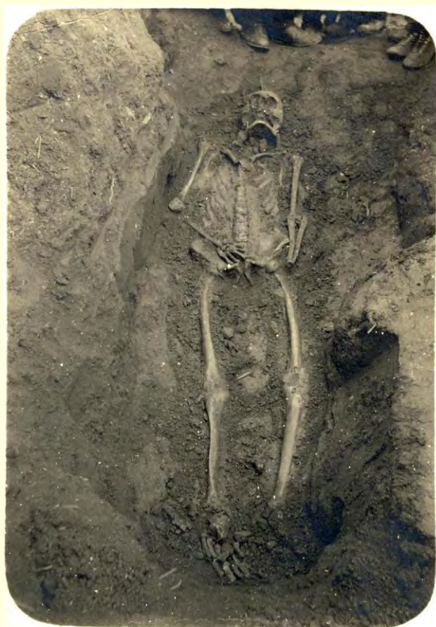
Kostra vykopaná v čsbr. hřbitově v r. 1928. na pozemku „Pochůvký“ ve Slížanech.

V r. 1840 byl vykopán ve Slížanech bratr. stříbrný cele pozlacený kalich i s jinými ještě starožitnostmi. Na krchůvkách vykopávají se často celé kostry lidské.