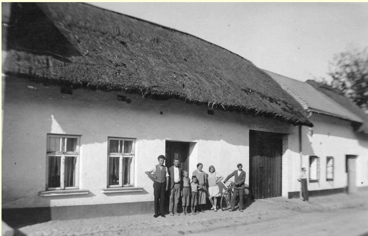
Dům č.p. 75 v roce 1932, majitel Alois Kouřil

Obecní hospodářství se velmi těžko provádí, jelikož úřady následkem neplacení daní málo posílají obci přírážek, taktéž i obecní nájmy, prodeje a různé příjmy obecní se pomalu scházejí, což má za následek velkou šetrnost a málo investic v obecním hospodářství.