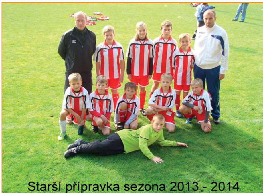
Starší příprava sezona 2013 - 2014