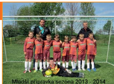
Mladší příprava sezona 2013 - 2014